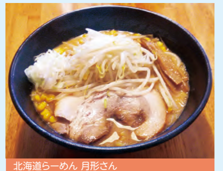
北海道らーめん 月形さん

「いるバル」は、入間市商工会が主催する地元の飲食店・サービス店を巡り、お得に美味しい料理やサービスを楽しめるイベントです。専用のチケットを購入し、参加店で提示することで「バルメニュー」を注文できます。 第8回「いるバル」については、来年2月頃の開催を予定しております。入間市のさまざまなお店を一度に味わえるイベントとして市民の方が参加されますので、お店の魅力をPRする絶好の機会です。ぜひ多くのお店のご参加をお待ちしております。イベントの詳細及び参加店募集については、チラシ及び入間市商工会ホームページにて周知いたしますのでご確認ください。